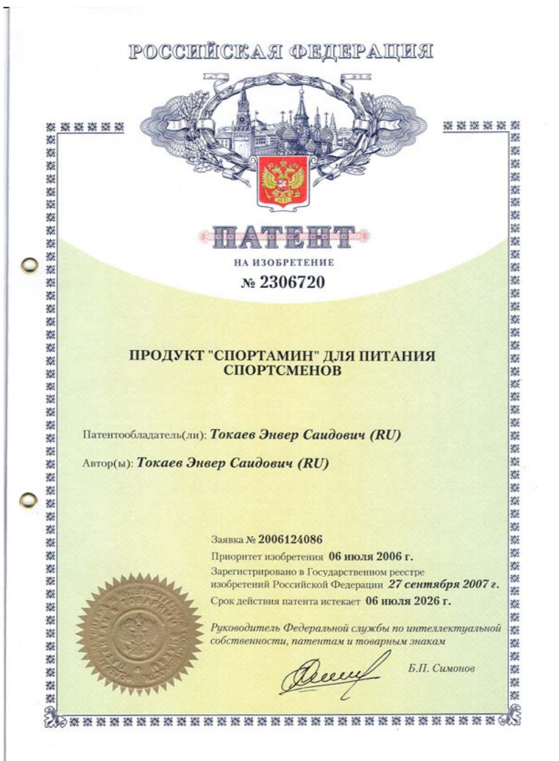
Патент на специализированный продукт для питания спортсменов «СПОРТАМИН»