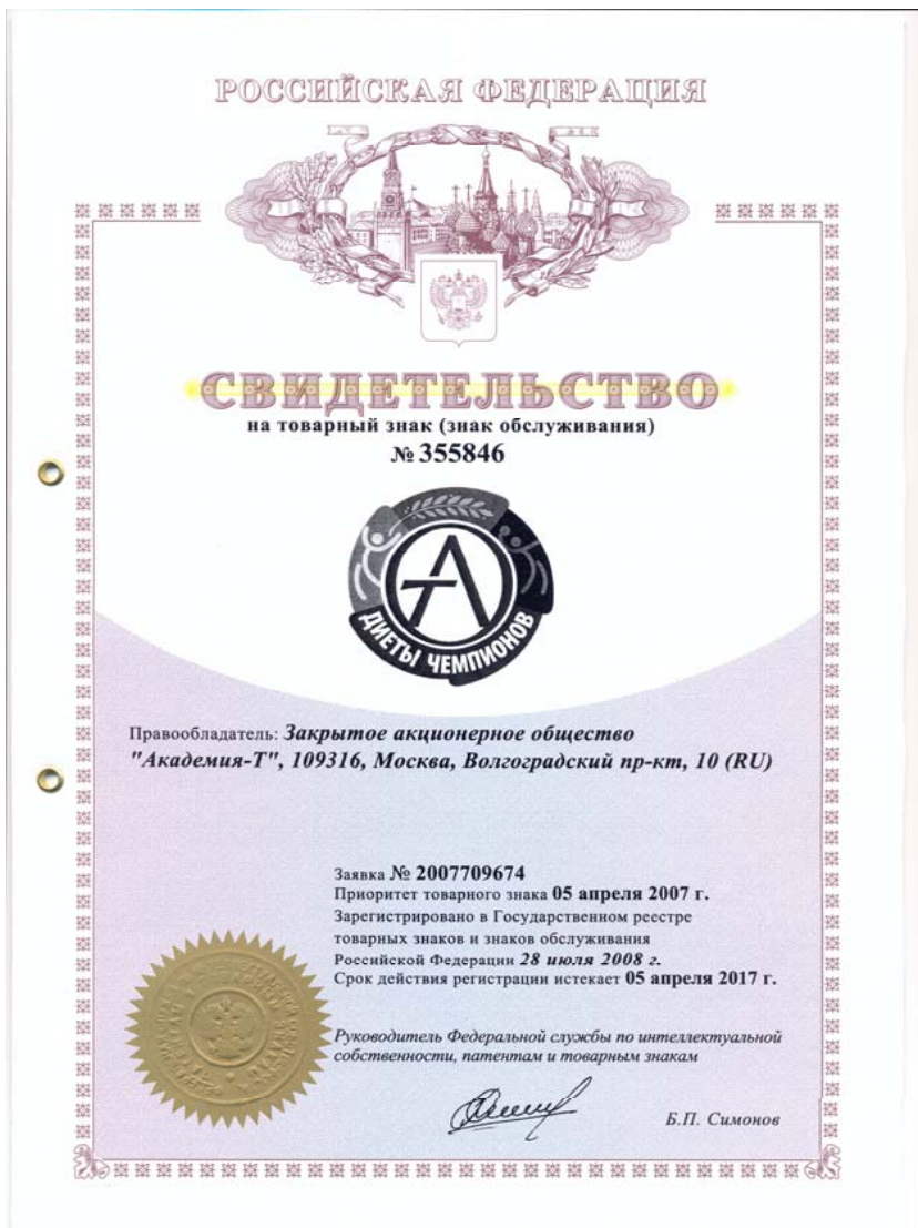
Свидетельство на товарный знак «ДИЕТЫ ЧЕМПИОНОВ»