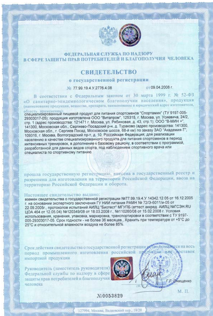
Свидетельство о государственной регистрации на специализированный пищевой продукт для питания спортсменов «СПОРТАМИН»