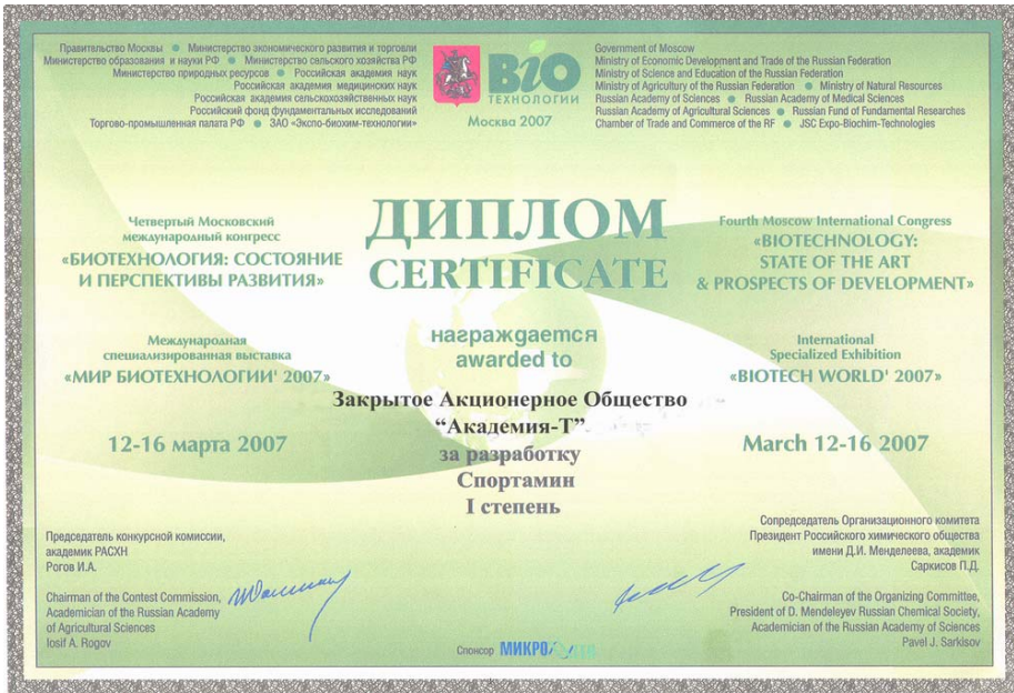
Диплом за разработку специализированного продукта для питания спортсменов «СПОРТАМИН»