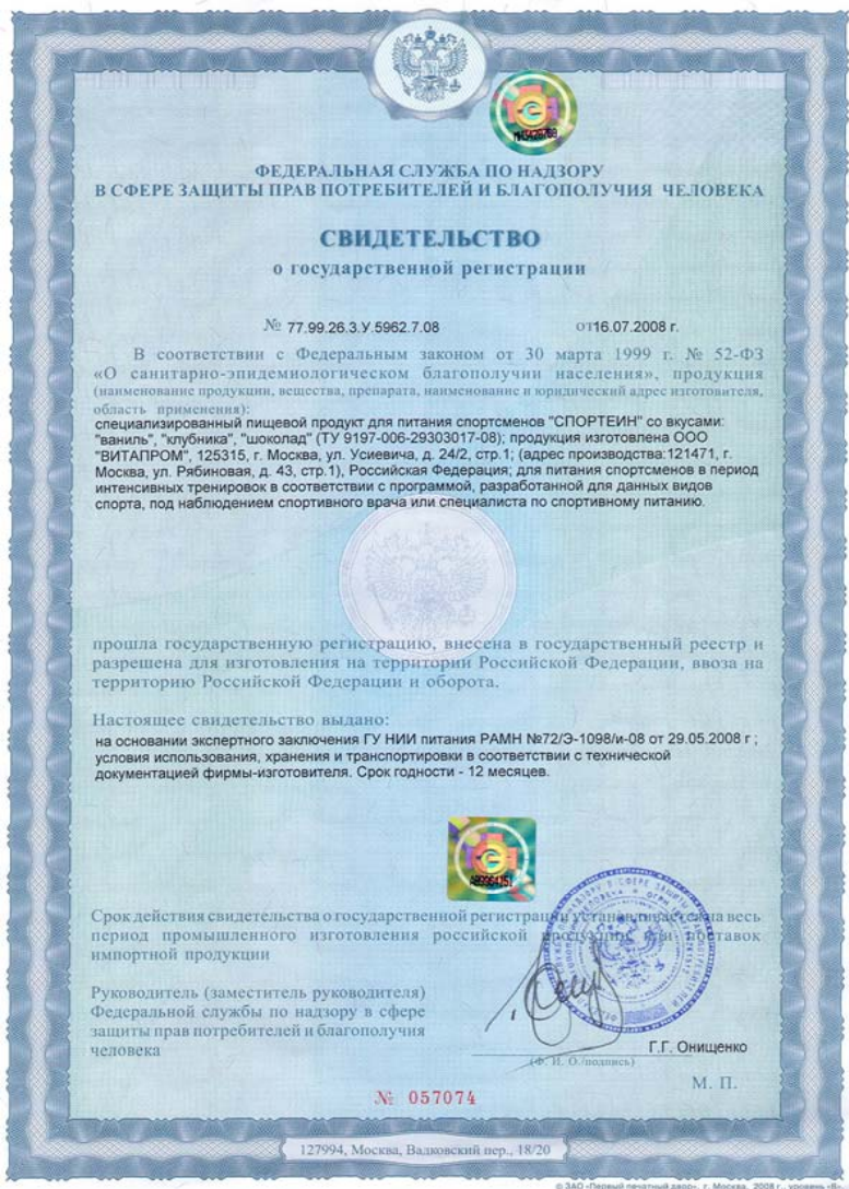
Свидетельство о государственной регистрации на специализированный пищевой продукт для питания спортсменов «СПОРТЕИН»