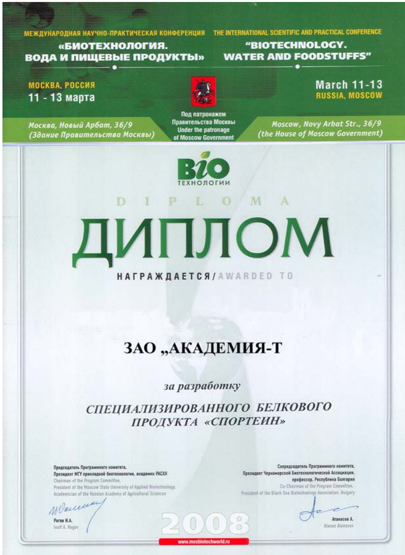
Диплом за разработку специализированного продукта для питания спортсменов «СПОРТЕИН»